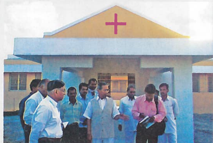
गावात उभे राहलेले आरोग्य केंद्र