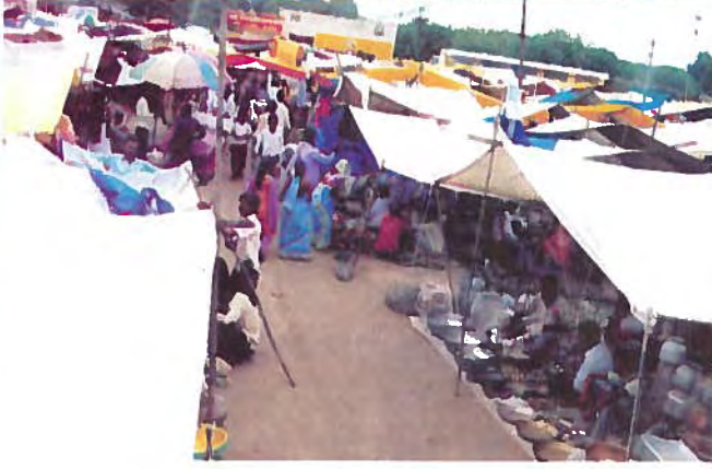
गावचा आठवडी बाजार

गावदेखील अपवाद नव्हते. या विकास प्रकल्पाच्या सुरवातीला गावातील गटबाजी थोपविणे आव्हानात्मक होते. ग्रामविकासाची सुरवात करताना ग्रामस्थांनी जर आपल्या गावाकडे आत्मीयतेने पाहिले तर गावचा कायापालट झाल्याशिवाय राहणार नाही असा विश्वास गावकऱ्यांमध्ये निर्माण केला. संघटन, जनजागृती व लोक प्रबोधनावर भर दिला. पायाभूत सुविधा असल्याशिवाय इतर विकास योजना राबवून चालणार नाही याची कल्पना होती. सरकारी योजनांचा लाभ गावाला मिळवून देत रस्ते, शौचालय, समाजमंदिर, अंगणवाडी, प्राथमिक-माध्यमिक शाळा, प्राथमिक आरोग्य केंद्र, शेती