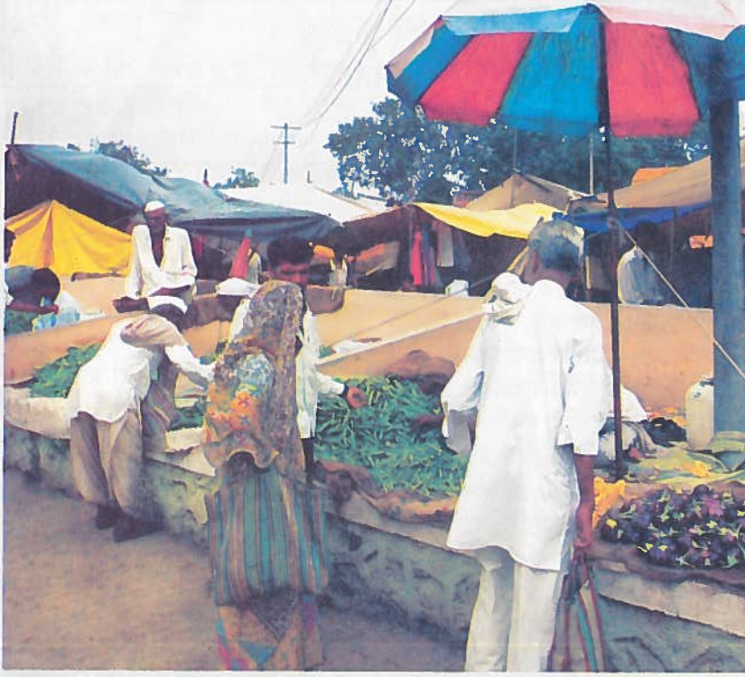
बाजार ओटे झाल्याने असा टापटीपपणा आला

चढउतार किती आहेत, त्यात किती महिने पाणी असते, त्याचा परिसरातील विहिरींवर काय परिणाम होतो, वनसंपदा किती हे जे ओळखतात ते त्याच्या नियोजनामागे लागतात. या दूरदृष्टिसाठी व प्रशिक्षणासाठी शासकीय पातळीवर विविध संस्था कार्यरत असतात. शासनाच्या विविध योजना ग्रामविकासासाठी आहेत. यात महात्मा ज्योतिबा फुले जल व भूमिसंधारण अभियान, नरेगा, स्वर्णजयंती ग्राम स्वरोजगार योजना,